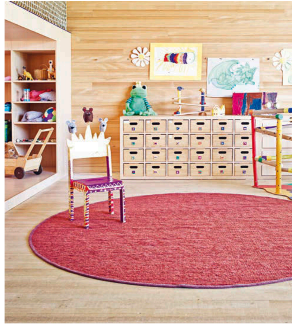
Teppich Olbia Konstanz col. 3320, gewalkt und Olbia Uni rund col. 3310, gewalkt Location Kindergarten Sattens, Vorarlberg – Austria

Ob rund, oval, rechteckig oder mehrrecks ist für uns reine Formsache. Für den morgendlichen Sitzkreis oder ganz einfach nur zum Wohlfühlen. Wir haben für jede Anforderung genau den richtigen Teppich. So macht das Spielen richtig Spaß.